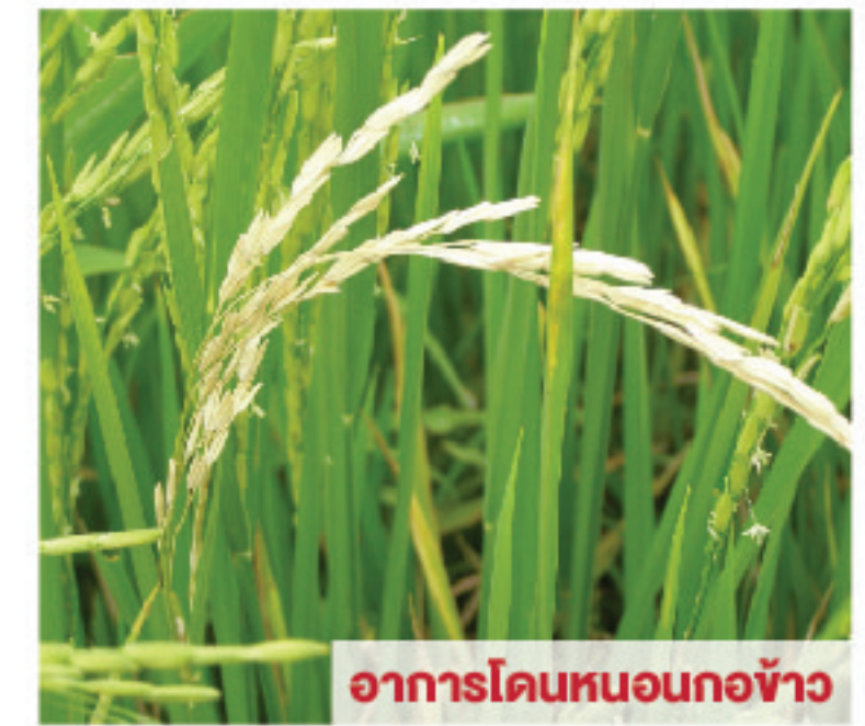
อาการโดนหนอนกอข้าว