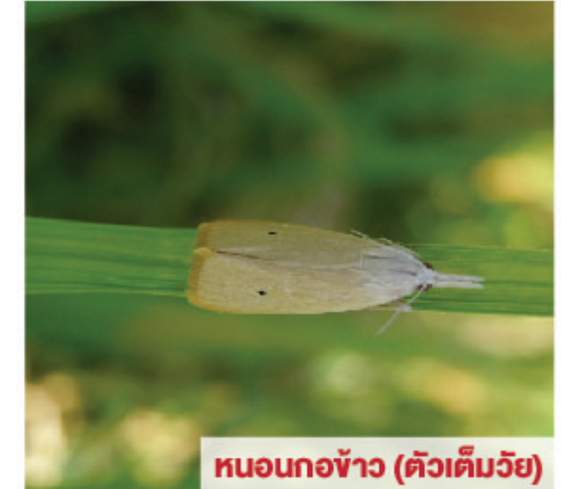
หนอนกอข้าว (ตัวเต็มวัย)