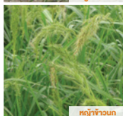
หญ้าข้าวแค้น